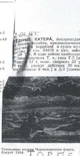
Торпедные катера Черноморского флота. Август 1944.