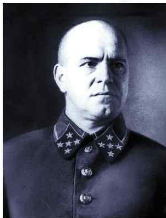
Г.К. Жуков, в июне 1941 г. – начальник Генштаба РККА