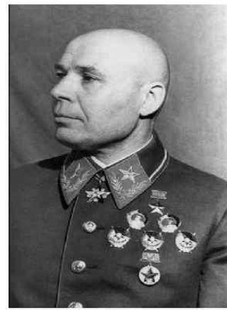
С.К. Тимошенко, в июне 1941 г. – Нарком обороны СССР, с 23.06 по 10.07 – Председатель Ставки