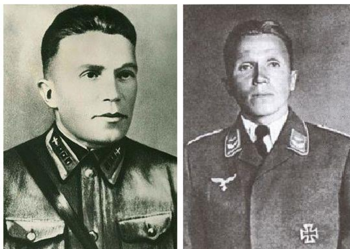
Кузнецов Николай Иванович — советский разведчик, партизан («обер-лейтенант Зиберт»).

За годы войны в борьбе с врагом во вражеском тылу погибло 2700 разведчиков.